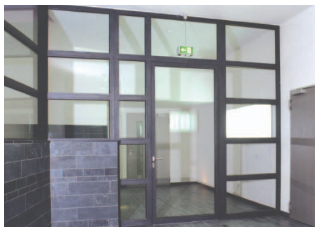
T30-Rohrprofilssystem mit einflügeliger Tür, Oberlicht und Seitenteil

zweiflügeligen Rohrprofilüren, Seitenteile, Oberlichter und Wandelemente sind flexibel kombinierbar – in unbegrenzter Breite und bis zu 4 Meter hoch. Alles aus den Werkstoffen Stahl, Edelstahl und Alu in vielen Farbtönen (RAL-Palette). Zahlreiche Variationen stehen auch für die Verglasung, Drückergarnituren und Bandtü-