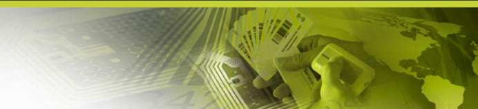
Liste der durchgeführten Kontrollgänge